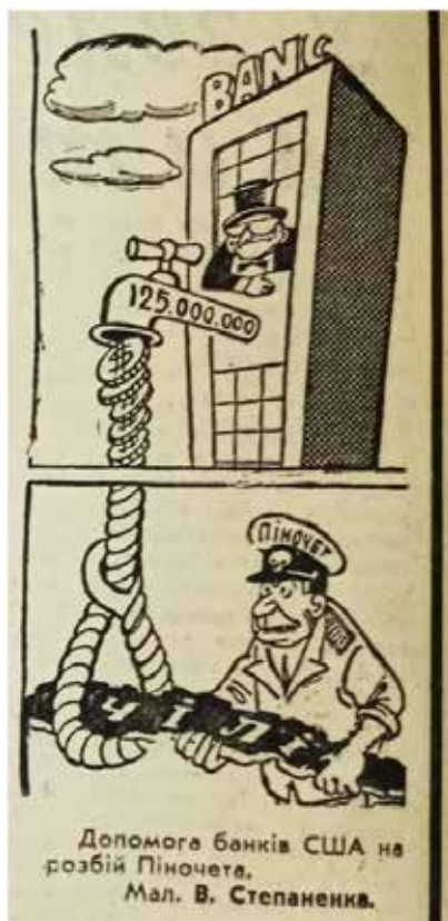
Мал. 1. [35, с.4]

перевороту, він був добрим товаришем президента С. Альєнде і займав високі військові посади при уряді «Народної єдності», зокрема й те, що 23 серпня 1973 р. президент С. Альєнде особисто призначив генерала А. Піночета головнокомандувачем сухопутних військ Чилі. Лише у 1974 р. в статті «Фашизм у Чилі – виклик свободі і людяності», яка була опублікована в газеті «Радянська Волинь» повідомлялося, що А. Піночет у 1956 р. займав посаду військового аташе в чилійському посольстві у Вашингтоні, а в 1965 р., 1968 р. і в 1972 р. начебто проходив спеціальні інструктажі і стажування серед керівництва Південного військового округу США в зоні Панамського каналу [2, с. 3]. Натомість А. Піночет фігурує в публікаціях як кровожерливий тиран, деспот, фашист, політичний бандит, антисоціаліст, який є маріонеткою в руках урядів США. Український історик В. Кириченко ще у 1992 р. в одній із своїх наукових публікацій влучно зауважив: «У радянській пресі Піночета зображували не інакше, як орангутаном у мундирі і в темних окулярах, що розпродує іноземним монополіям національне багатство Чилі» [13, с. 75]. Таке твердження В. Кириченка цілком відповідає одній із карикатур на А. Піночета в газеті Горохівського району «Будівник комунізму» за 18 вересня 1976 р. (див. мал. 1) [35, с. 4].